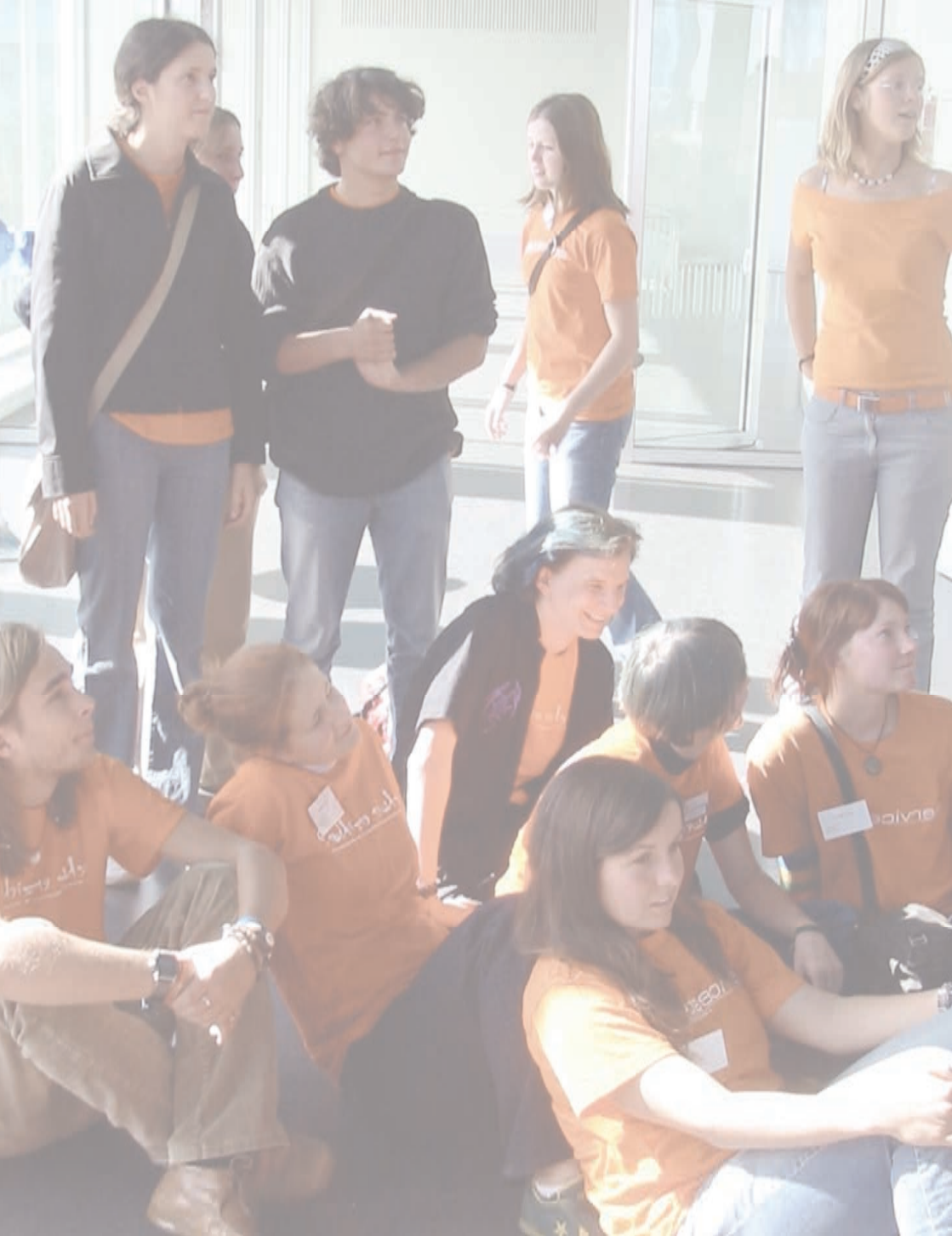
Mitglieder des BAK „Schüler gestalten Schule“ beim Ganztagschulkongress 2004